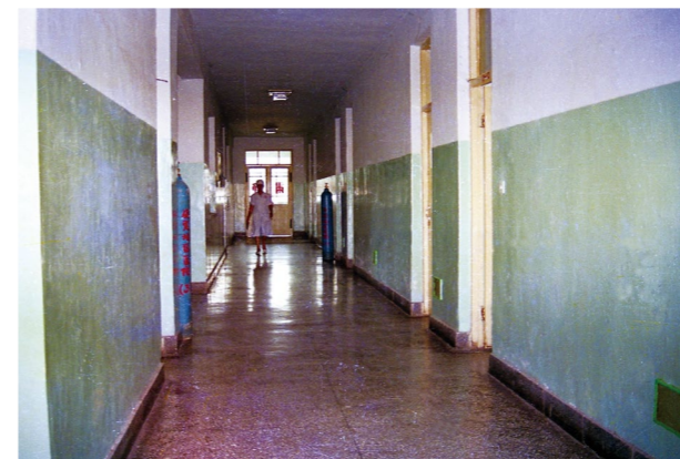
80年代干部病房楼道