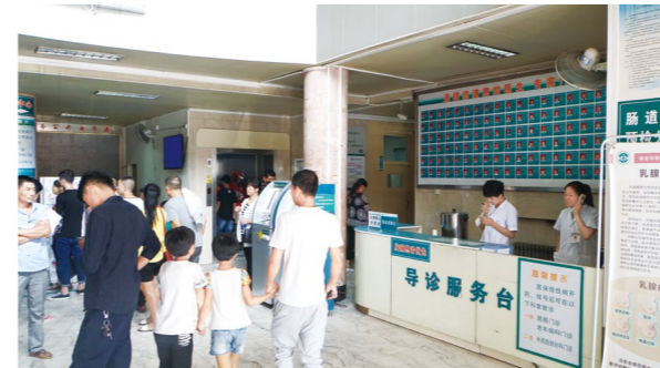
2014年门诊楼大厅及导诊服务台