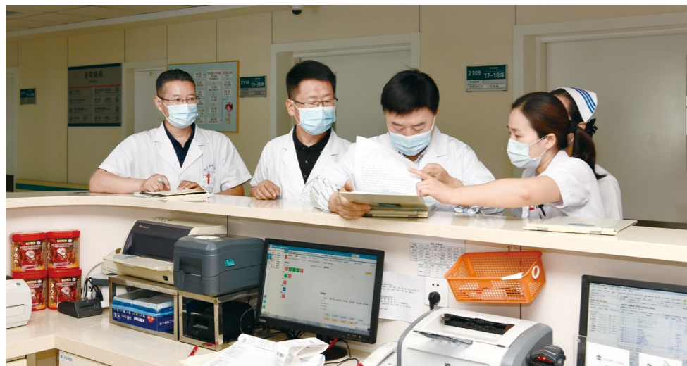
评审专家通过抽查考核的方式对病案记录进行检查评审

自2022年5月31日河北省卫生健康委员会下发《关于河北省人民医院等23家三级医院评审评价结果的通知》中获悉，保定市第一中心医院以优异的成绩通过省卫健委组织的新一轮三级甲等医院复审。