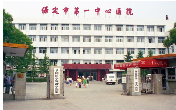
1995年地市合并后保定市第一中心医院大门